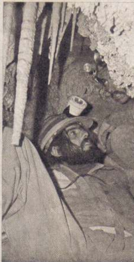
Uno de los pasajes más estrechos y, al lado, las estalactitas documentadas por el autor.

"El clima durante el verano tiene la característica de ser cálido durante el día y fresco por las noches. En esta estación se registran lluvias violentas y de corta duración, frecuentemente acompañadas de pedriscas. Los meses de enero y febrero son los únicos del año que pueden considerarse libres de heladas. El cielo se mantiene prácticamente libre de nubes. El otoño resulta generalmente seco, templado durante el día y más bien frío por la noche. En la época invernal, la temperatura alcanza a descender hasta 20° bajo cero por las noches; pero, durante el día se mantiene el cielo despejado y aquélla se eleva por sobre los 10°. En la región montañosa nieva con frecuencia. Durante la primavera, los días son cálidos y, las noches, regularmente frías, con temperaturas por debajo de 0°. Los vientos resultan frecuentes durante todo el año y, en general, soplan del Noroeste o del Sureste. Los suelos son prácticamente esqueléticos. Clima y suelo controlan la vida vegetal y, como a su vez el primero de los factores está condicionado por la altitud, existen diferentes "pisos" de vegetación. Las condiciones más favorables para el crecimiento de las plantas se hallan comprendidas aproximadamente entre los 1800 y 2200 metros sobre el nivel del mar.