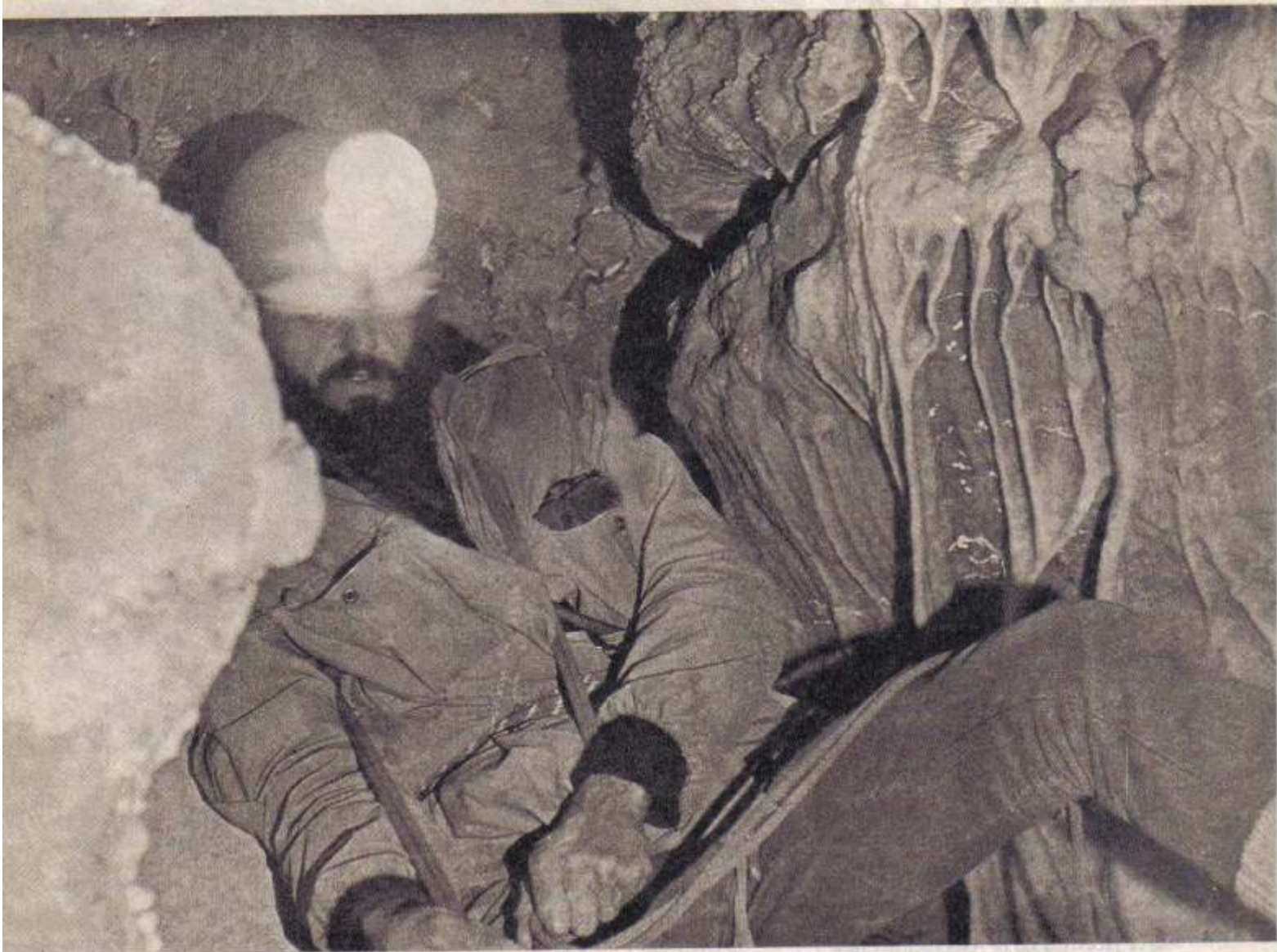
El explorador cuida de su seguridad con el empleo de las cuerdas. Detrás de él, se pueden apreciar las colgaduras llamadas "velos".

ras más o menos perpendiculares a los bancos de estratificación. Si se trata de una fractura simple, que es el caso más habitual, recibe el nombre de diaclasa . Cuando uno de los bordes se ha deslizado con respecto a otro y ya no coinciden las juntas de estratificación, recibe el nombre de falla . La presentación externa de la roca caliza es característica: se dispone en "panes" casi regulares, de color blanco-grisáceo, de aspecto ruinoso, y reacciona a temperatura ambiente con el ácido clorhídrico. El agua de las precipitaciones comienza a filtrarse por las fisuras, fallas, diaclasas y juntas de estratificación, iniciando su trabajo de erosión (abrasión y corrosión) sobre la roca. El principal constituyente de la roca calcárea es el carbonato de calcio, que es insoluble aunque se torna muy soluble cuando