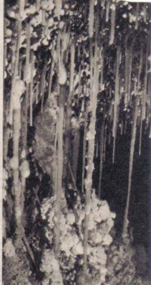
Uno de los pasajes más estrechos y, al lado, las estalactitas documentadas por el autor.

"A esta altura, las formaciones leñosas y herbáceas alcanzan su mejor desarrollo. Entre los arbustos más importantes están la jarilla (varias especies del género Larrea ), el molle, el chañar ( Gourliea decorticans ) y el solupe ( Ephekra sp.). Por arriba de los 2200 metros de altitud, la cubierta vegetal se empobrece rápidamente a causa del clima desértico y frío reinante, ya que el agua contenida en el suelo permanece congelada la mayor parte del año. Casi la totalidad de la superficie permanece desnuda de vegetación y el resto está poblada por especies adaptadas a ese ambiente, tales como las llaretas ( Azorella sp.sp.), que forman cojines y proveen de la única leña a la que pueden recurrir los arrieros que atraviesan la cordillera. Por debajo de los 1800 metros de altura, con la disminución de las precipitaciones, la cubierta vegetal se hace más rala y los elementos que la componen disminuyen de tamaño."