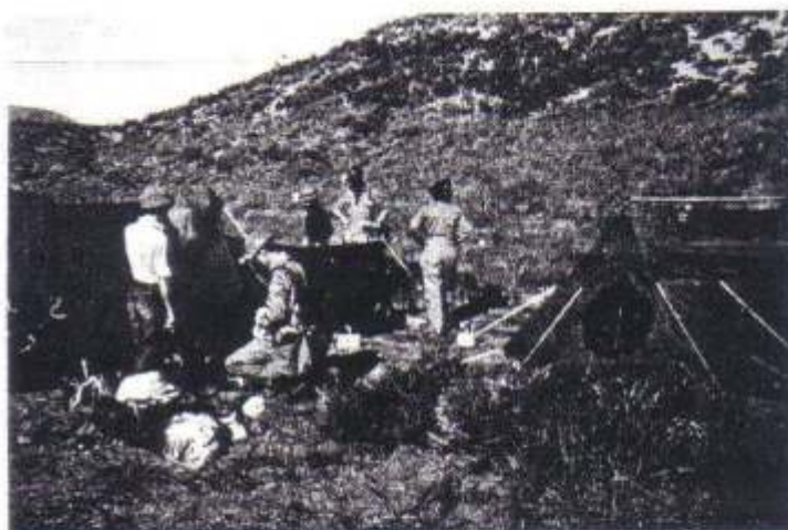
Hauptlager in "Cueva del León". (Löwenhöhle).