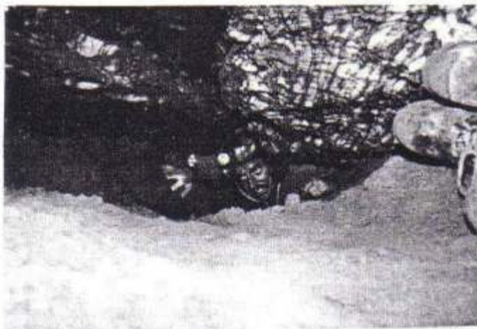
Gezwungener Pass, 27 Meter lang, im Osten der "Cueva del León" (Löwenhöhle).

Galerien die von Espeleothemen einer unsagbaren Schönheit tapeziert sind. Auf jedem Schritt befinden sich Stalaktieten und Stalagmieten, Schleier und Gours die sich in eine unvergleichliche Polychromie entfalten. Der Wissenschaftler, sowie auch der Besucher und Laie wird von dieser sagenhaften Schönheit angezogen. KARST arbeitet jetzt and der Anvertigung des nationalen Speleologischen Kataster und an der Verwirklichune der Gründung einer Speleologischen - Schule in Argentinien.