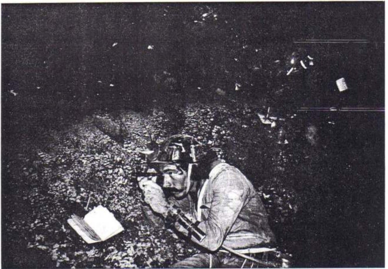
Topographische Arbeit in "Cueva del León" (Löwenhöhle).

unterirdischer See, dessen Spiegel ungefähr 40 Meter Durchmesser besitzt und 30 Meter Tiefe. Es besteht die Möglichkeit, dass er noch tiefer ist. Man versuchte die wirkliche Tiefe des Sees zu ergründen, und eine wahrscheinlich, versenkte Höhlenbildung zu entdecken. Ausserdem wurden chemische und bakteriologische Studien des Wassers ausgeführt und auch Muster - Proben entfernt um die Existenz von Plankton festzustellen. Die Proben wurden an die Universität in Moron (Vorort von Buenos Aires) gesendet und an die