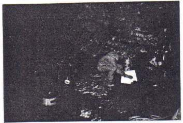
Einige Mommente vor der Tauchung in den See zur "Cueva del León" (Löwenhöhle).

Sie befindet sich in der Quelle, an dem Hang eines Berges, ungefähr auf 150 Metern Höhe und ist eine typische Höhle des karstischen Bodens, mit verzweigten